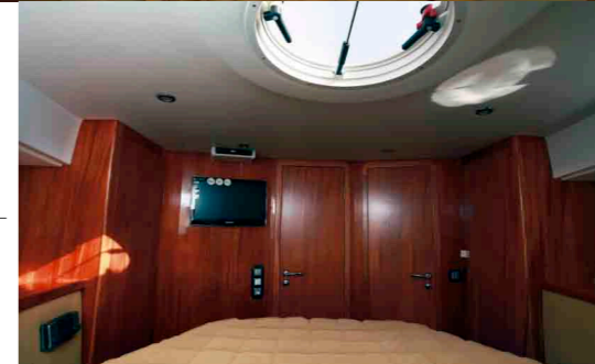
Мастеркаюта Каюта владельца спроектирована и оформлена очень продуманно и качественно. Полноразмерная двуспальная кровать весьма комфортна.