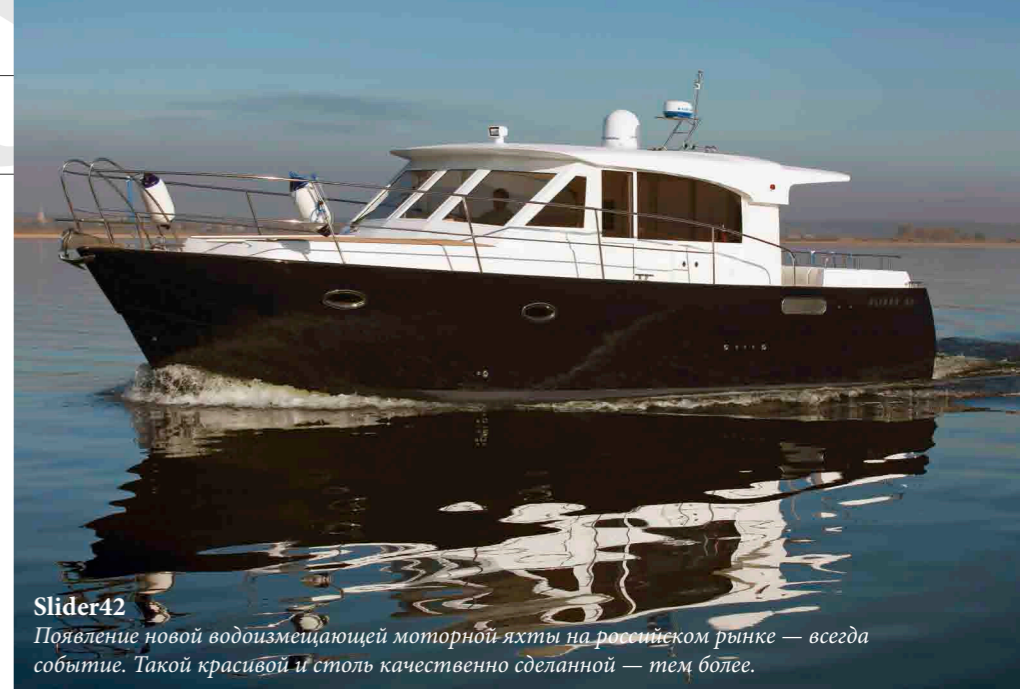
Slider42 Появление новой водоизмещающей моторной яхты на российском рынке — всегда событие. Такой красивой и столь качественно сделанной — тем более.