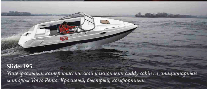
Slider195 Универсальный катер классической компоновки cuddy cabin со стационарным мотором Volvo Penta. Красивый, быстрый, комфортный.