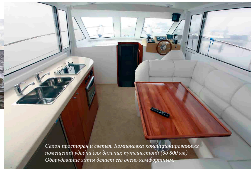
Салон просторен и светел. Компоновка кондиционированных помещений удобна для дальних путешествий (до 800 км). Оборудование яхты делает его очень комфортным.