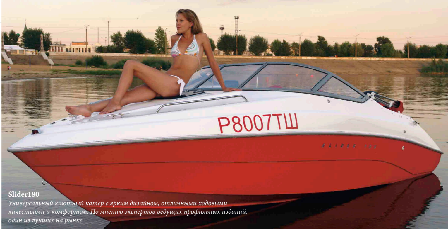
Slider180 Универсальный каютный катер с ярким дизайном, отличными ходовыми качествами и комфортом. По мнению экспертов ведущих профильных изданий, один из лучших на рынке.

Существенной проблемой отечественного рынка маломерных судов, к сожалению, являются недобросовестные изготовители. Беда в том, что в настоящее время в данной сфере присутствует много случайных людей, далеких, по сути, от этого дела. Многие, кто начинает заниматься катерами, стремятся, естественно, к тому, чтобы их продукция хорошо продавалась и приносила прибыль, но при этом они не имеют соответствующего образования или опыта, у них нет системного подхода. Большинство из них стремятся занять определенное место на рынке только за счет демпинговой цены. И в этом, на мой взгляд, заключается огромная ошибка. Хорошая вещь не может быть дешевой. Хотя неправильно и загибать цены, чем грешат некоторые производители. В результате человек, однажды купивший отечественный катер и разочаровавшийся в нем, часто начинает негативно судить и о других российских компаниях. И это, конечно же, неправильно. В каждом отдельном