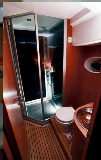
Санузел мастеркаюты Отделка махагоном и лиственницей