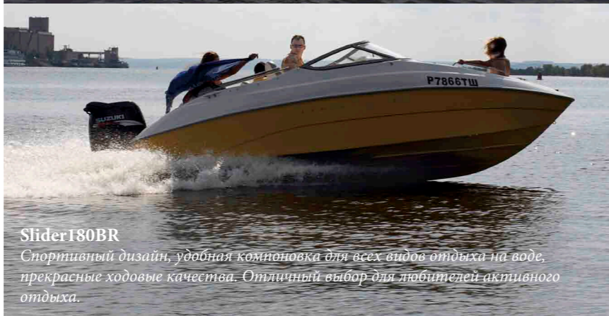
Slider180BR Спортивный дизайн, удобная компоновка для всех видов отдыха на воде, прекрасные ходовые качества. Отличный выбор для любителей активного отдыха.

случае необходимо смотреть и выбирать конкретную модель. Если же вы решаете приобрести катер где-то за границей, не стоит забывать и о его последующем сервисном обслуживании. Сможет ли оно быть обеспечено в России в полной мере? Так что нельзя сказать, что покупка импортной модели станет лучшим выбором.