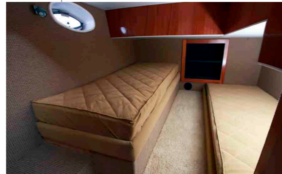
Гостевая каюта Двухместная каюта для гостей вместительна, дает возможность для полноценного отдыха и место для хранения многих вещей. Есть гостевой галлюн.