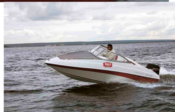
Slider160BR Небольшой, легкий, вместительный bow-rider соединил в себе все достоинства семейства Slider от дизайна и ходовых качеств до привлекательной цены при неизменном качестве.

– Это один из первых вопросов, который задают покупатели. Ответ один: катер может быть любым, главное — чтобы он был новым. Надо помнить о том, что если вы встанете на дороге, к вам придет эвакуатор и проблема будет каким-то образом решена. А на воде все может сложиться несколько иначе, и нередки случаи, когда рассчитывать приходится только на себя. ■