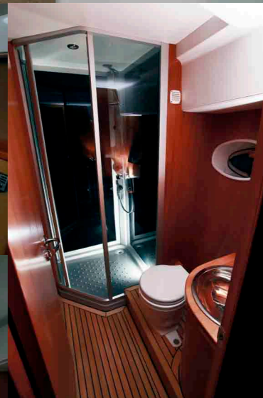
Санузел мастеркаюты Отделка махагоном и лиственницей