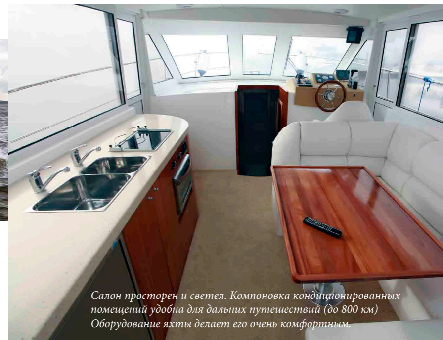
Салон просторен и светел. Компоновка кондиционированных помещений удобна для дальних путешествий (до 800 км). Оборудование яхты делает его очень комфортным.

– Это один из первых вопросов, который задают покупатели. Ответ один: катер может быть любым, главное — чтобы он был новым. Надо помнить о том, что если вы встанете на дороге, к вам придет эвакуатор и проблема будет каким-то образом решена. А на воде все может сложиться несколько иначе, и нередки случаи, когда рассчитывать приходится только на себя. ■