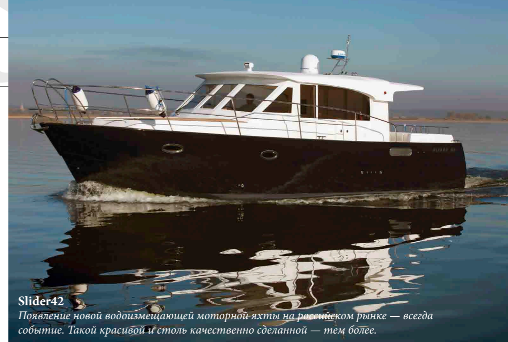
Slider42 Появление новой водоизмещающей моторной яхты на российском рынке — всегда событие. Такой красивой и столь качественно сделанной — тем более.