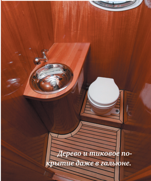
Дерево и тиковое покрытие даже в гальюне.

Каюта владельца очень комфортна, оформлена без пафоса и со вкусом. Входы в душевую и гальюн (раздельные). Световые люки обычно тонируются, но свет и солнце в каюте тоже к месту.